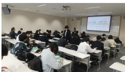
職場・上級学校見学 (1年次10月)