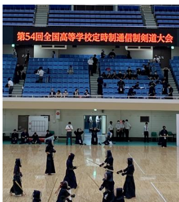
剣道部全国大会出場