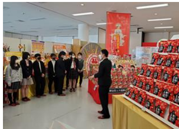
職場・上級学校見学 (2・3年次5月)