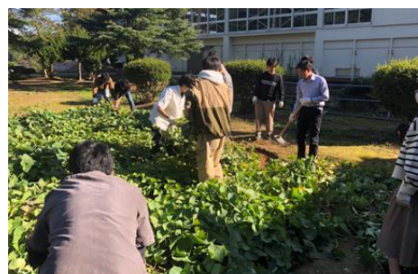
地域の自然環境(学校設定科目)