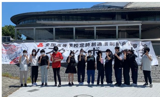
バスケットボール部全国大会出場